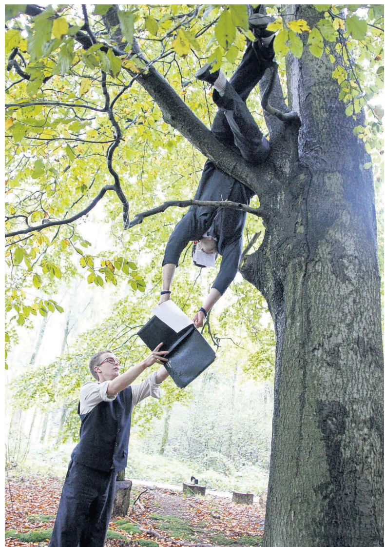
• Studenten van de Academie voor Circus en Performance Art (ACaPA) gaven in 2010 een voorstelling in de buitenlucht op landgoed Velder.

De gemeente Boxtel noemt de stopzetting van de subsidie aan het circusevenement 'een keuze die haar in hoge mate verbaast'. „Noord-Brabant wil in 2018 de Culturele Hoofdstad van Europa zijn en binnen dit project wordt Circo Circolo altijd genoemd als belangrijk evenement om de felbegeerde titel binnen te kunnen halen. Het is een evenement met internationale allure”, aldus het college. „Met de subsidie-stop wordt Circo Circolo volledig op de tocht gezet, waarmee de provincie ook de nominatie van Culturele Hoofdstad op losse schroeven zet.”